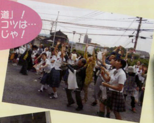
「もちまき道」! たくさん捨てるコッパは… 下を見よ!じや!