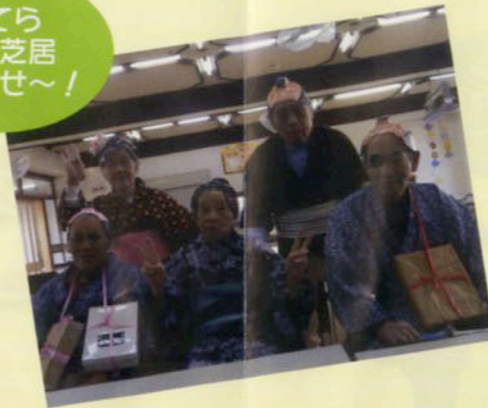
わてら ええ芝居 しまっせ~!