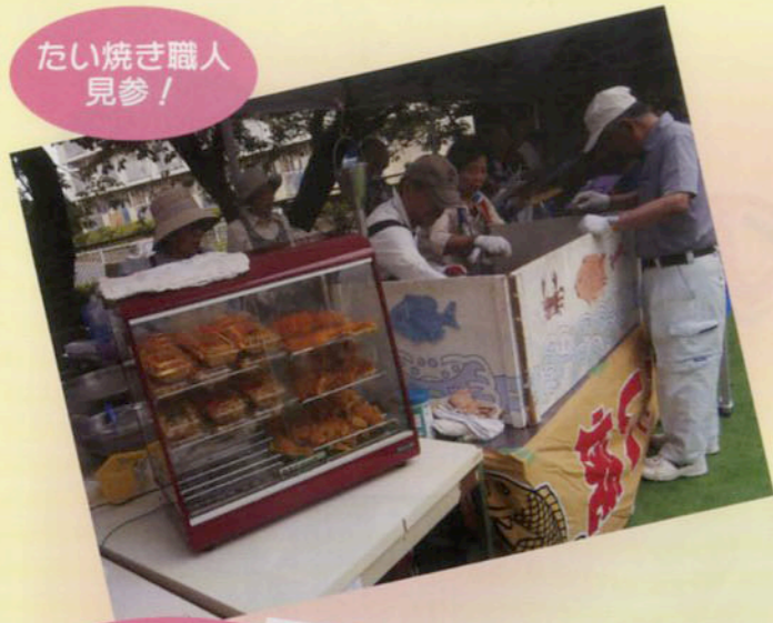
たい焼き職人 見参!