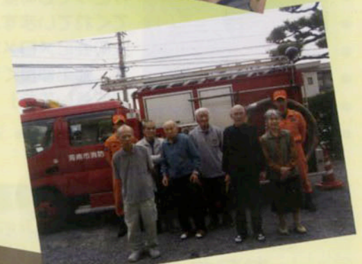
只今100歳! 「150歳までは いきます」と 頼もしいお言葉!