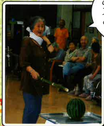
あれ! スイカは どこへ行ったの?