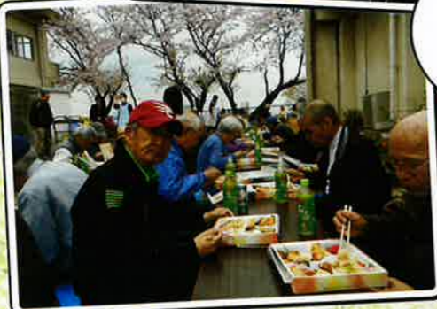
花見 (動物園・施設庭)