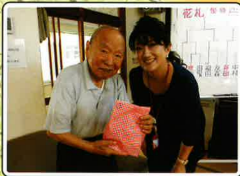
オセロ・花札・将棋大会