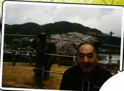
動物園に ゾウが来たぞう!?