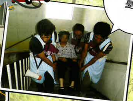
備えあれば 憂いなし!!