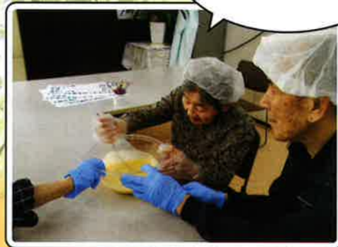
クラブ・レクリエーション活動