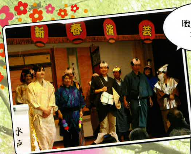
職員による 爆笑劇