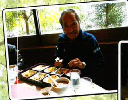
誕生会 レストランでの外食