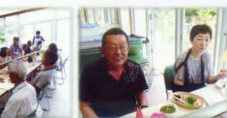
普段の3倍は 食べられる〜♪