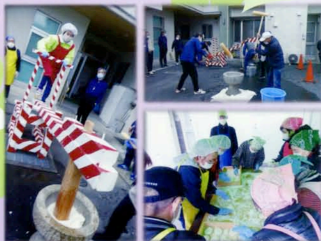
ヨイショー ヨイショー